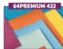
Premium betræk på stol