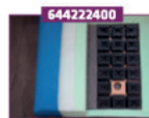
Sæde m. trykafastende fjedre. Fås kun med Premium betræk