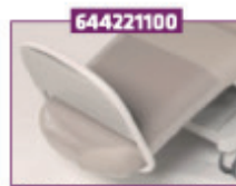
Cover transparent for bendel