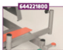
Holder for infusionsstativ