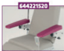
Armlæn med polstring i stedet for integral skum