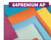
Premium betræk armlæn