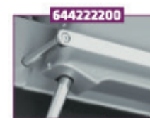
Kulisseskiner på sædedel