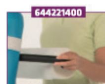
Kørehåndtag med papirulleholder