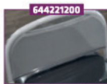
Cover transparent for fodstøtte