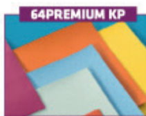
Premium betræk nakkepølle/relax pude