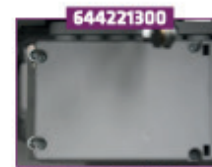
Batteri for trendelenburg